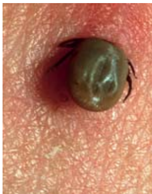
Figura 4 Rimuovere le zecche: afferrare la zecca il più possibile vicino alla pelle con la pinzetta ed estrarla perpendicolarmente rispetto alla superficie cutanea. Disinfettare la ferita.