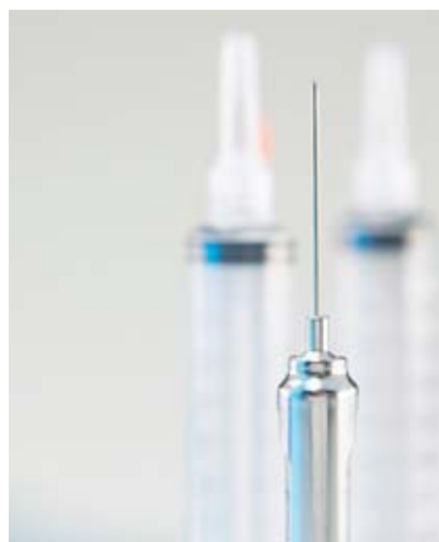
Figura 5 La vaccinazione contro la FSME offre una valida protezione.